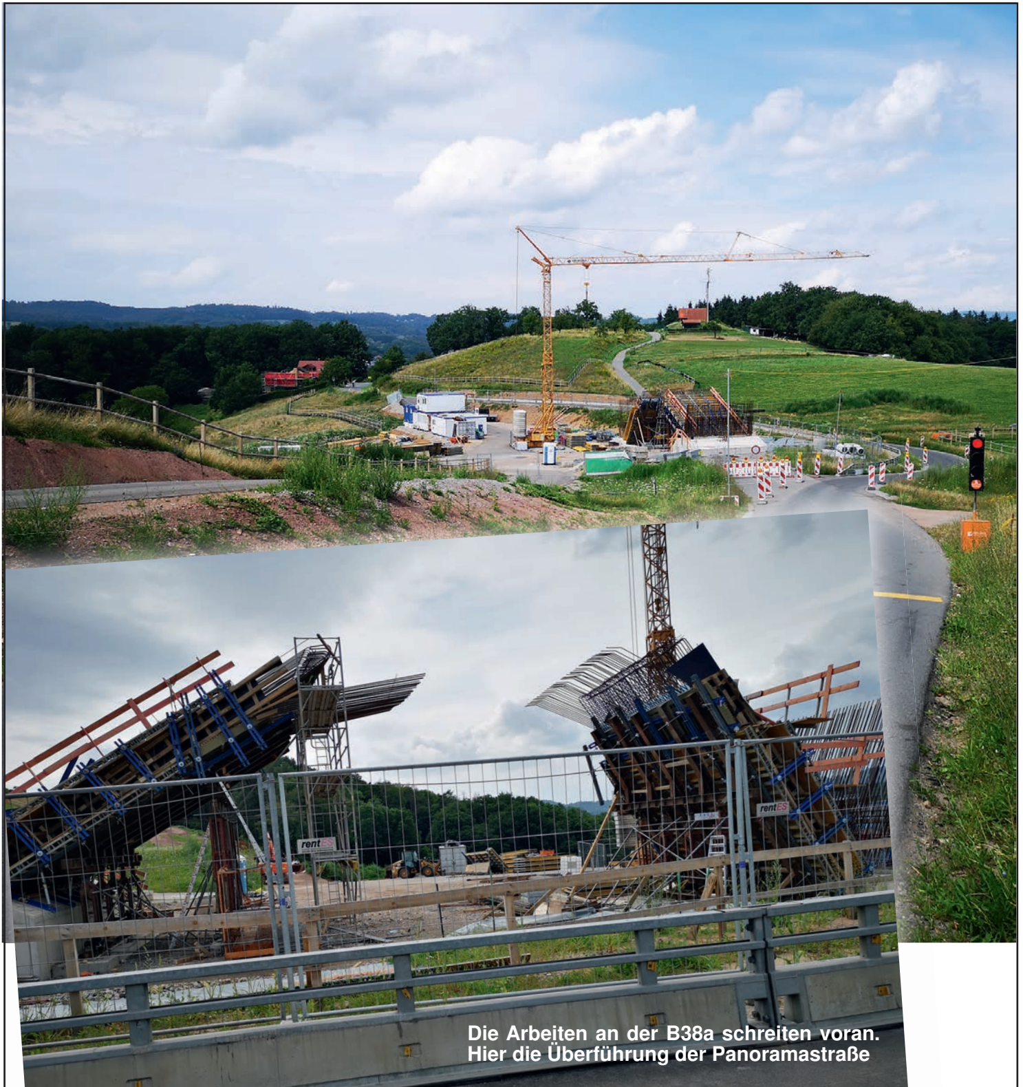
Die Arbeiten an der B38a schreiten voran. Hier die Überführung der Panoramastraße

für die Gemeinde Mörlenbach und die Ortsteile Weiher - Bonsweiher - Ober-Mumbach - Vöckelsbach - Juhöhe - Ober-Liebersbach