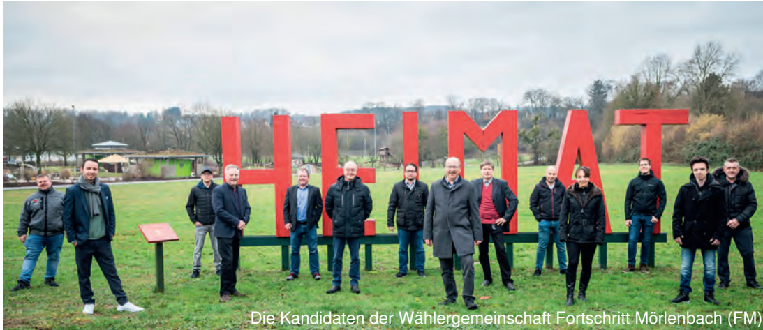
Die Kandidaten der Wählergemeinschaft Fortschritt Mörtenbach (FM)

Mehr als 30 Jahre Erfahrung • 24h Notdienst • www.buerner-rohrereinigung.de