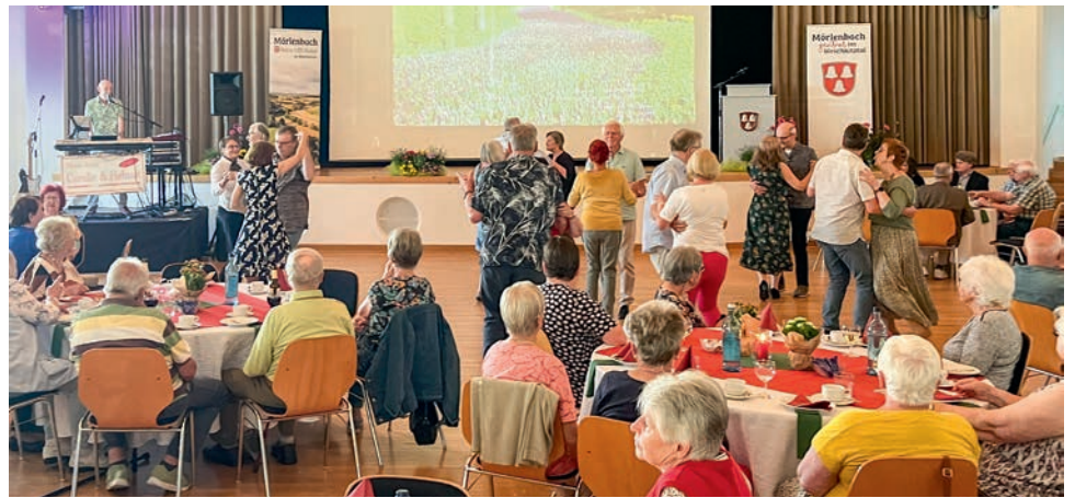
Der Seniorennachmittag 2025.