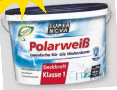
Polarweiß SUPERNOVA 10 L

10 Liter statt 42,95 € 29.90 € (L = 2.99 €)