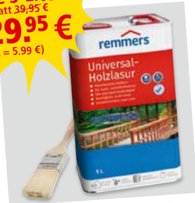
Universalschutzlasur 5 L

Je 5 Liter statt 39,95 € 29.95 € (L = 5.99 €)