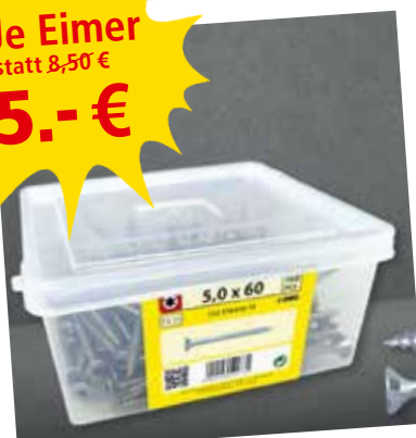
Spanplattenschrauben Torx Verschiedene Abmessungen

Rindenmulch 60 L | 3 Sack 10.- € Blumenerde 40 L | 2 Sack 5.- € Pflanzenerde 60 L | pro Sack 5.- €