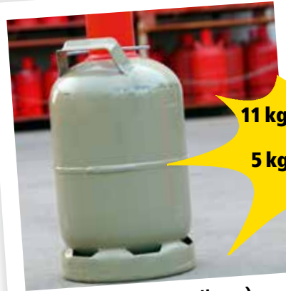
Propangas (nur Füllung)