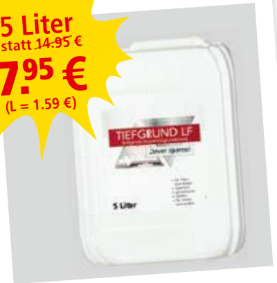
Tiefgrund LF 5 L Clever sparen!

5 Liter statt 14,95 € 7.95 € (L = 1.59 €)