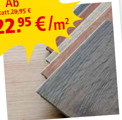
Vinyl Fußboden Verschiedene Farben

KEIL - Ihr Partner am Bau! Jetzt ab 4.4.2022 Industriestraße 14a • 69509 Mörlenbach